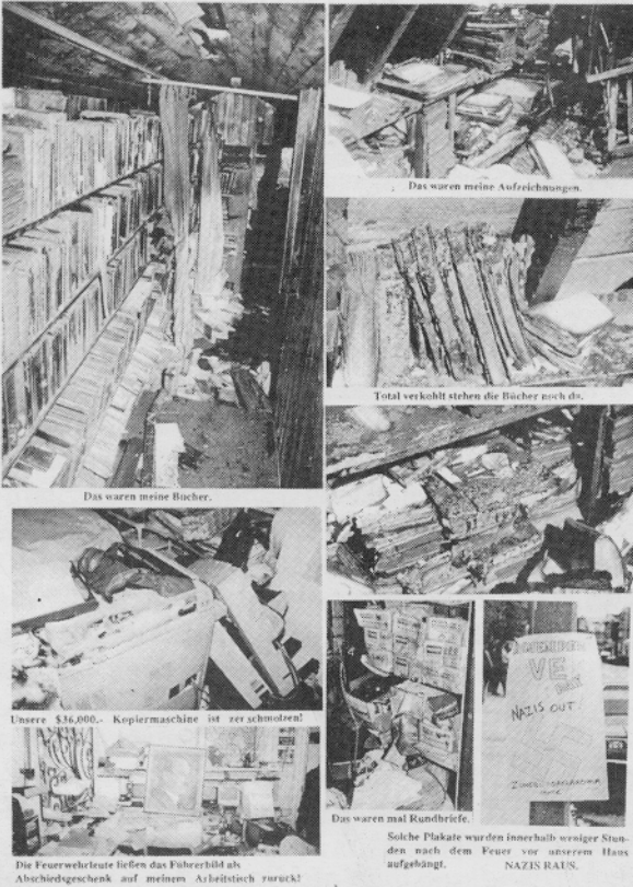
Das waren meine Bücher.