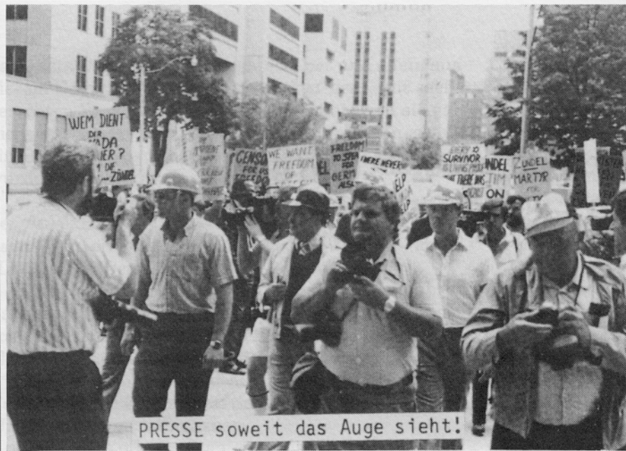
PRESSE soweit das Auge sieht!

rational sind." (BVerfGE 61, 1 7; 85, 1, 15 + BVerfGE 90, 1, 15/15)